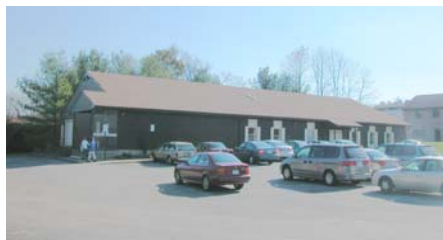
Services chrétiens de Howard County

Mardi et jeudi 10 h à 13 h le 2 e et 4 e samedi de chaque mois 10 h à 13 h