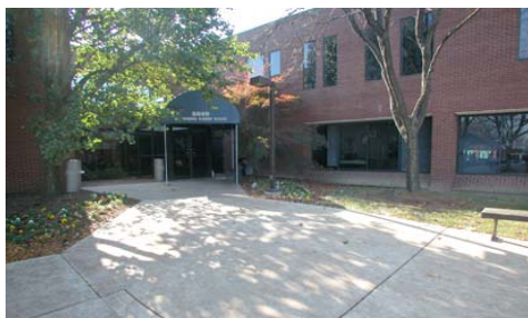
Entrée de FIRN : Bureau de Columbia

FIRN: Bureau de Columbia Assistance Communautaire pour les Immigrants et les Réfugiés 5999 Harpers Farm Rd Suite-E200 Columbia , MD 21044 Tél: 410-992-1923 Fax ; 410-730-0113 Email info@firnonline.org Website: www.firnonline.org