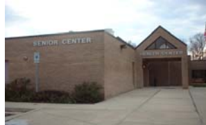
BUREAU DE SAVAGE

Les Services: Immunisations , Jeune adulte, soins prénatals gratuits, planning familial , test et conseil du HIV et des infections sexuellement transmissibles, programme de nutrition pour l'enfant , Healthy Start Program, soins de santé aux réfugiés, immunisation contre venin, séance d'information sur la tuberculose, le sida.