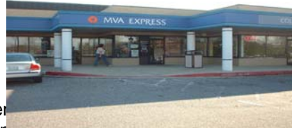
MVA Express, Columbia, MD

Heures de bureau: Lundi à vendredi: 8 h 30 à 16 h 30 Samedi: 8 h 30 à 12 h pour les services du permis de conduire seulement.