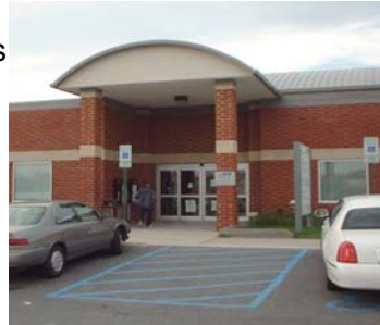
MVA Office, Beltsville, MD

Notez: Plusieurs pièces sont exigées pour enregistrer ou obtenir un permis de conduire. Appelez le MVA ou FIRN pour vous renseigner sur les pièces à fournir