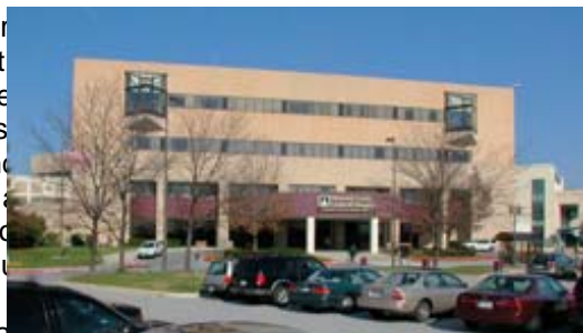
Howard County General Hospital

Appelez le 911 sur votre téléphone. Donnez votre nom, adresse, et numéro de téléphone. Donnez l'adresse où se trouve le cas d'urgence. Faites connaître ce numéro à vos enfants au cas où ils ont besoin d'aide quand vous n'êtes pas à la maison. Si vous ne parlez pas anglais, dites votre langue à l'opérateur pour avoir un interprète.