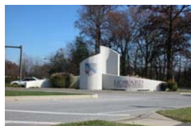
(HCC) Howard Community College

Howard Community College (HCC) (Collège communautaire de Howard) offre les classes d'anglais en tant que seconde langue à deux endroits. Les classes ont lieu pendant les semestres de l'automne et du printemps et elles sont gratuites pour les immigrants débutants et intermédiaires.