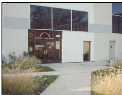
Departamento de Servicios Sociales

Llame al Departamento de Servicios Sociales si su familia tiene necesidad de obtener cupones de alimentos, asistencia médica u otro tipo de servicio social. Ahí le indicarán si cumple los requisitos para ser incluido en el programa de asistencia gubernamental. Trate de llegar temprano en el caso de que le citen en la misma oficina. www.dhr.state.md.us