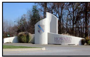
Entrada a HCC desde Little Pautuxent Parkway

Howard Community College (HCC) ofrece clases de inglés como segunda lengua en dos centros. En los semestres de otoño y primavera las clases son gratis para inmigrantes con nivel de principiante o nivel intermedio. No obstante, aunque la formación es gratuita, todos los estudiantes necesitan inscribirse. La inscripción comienza varias semanas antes del inicio de las clases. Llame para formalizar su inscripción con suficiente tiempo de antelación, puesto que los cupos se completan rápidamente.