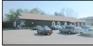
Servicios Cristianos del Condado de Howard

Horas: martes y jueves de 10:00am - 1:00pm El segundo y cuarto sábado de cada mes de 10:00am - 1:00pm