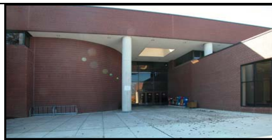
Legal Aid Bureau - Ellicott City

Teléfono: 410-480-1057 (puede dejar su mensaje en el contestador automático) O llame a la oficina central: 1-888-215-5316 durante las horas siguientes: