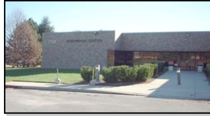
Banco de Alimentos

Oakland Ridge Industrial Park 8920 Route 108, Suite A Columbia, MD 21045