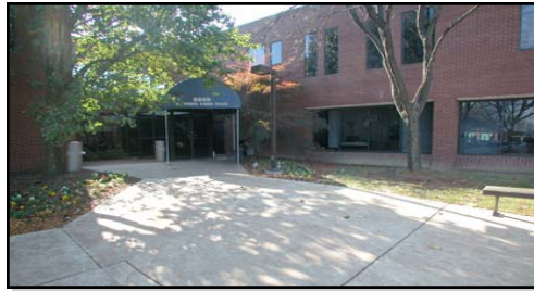
Fachada de la entrada a FIRN: Columbia