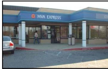
MVA Express, Columbia, MD

Horario: de lunes a viernes, de 8:30am - 4:30pm sábado: 8:30am - 12:00pm, para servicios de licencia de conducir, exclusivamente.