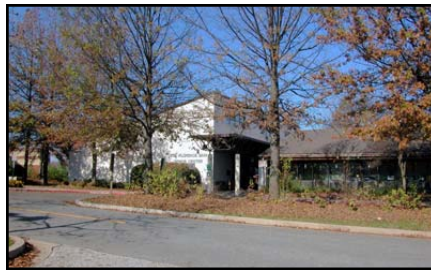
Florence Bain Center

5470 Ruth Keeton Way Columbia, MD 21044 Teléfono: 410-313-7213 Horario: de lunes a viernes de 8:00am-4:30pm