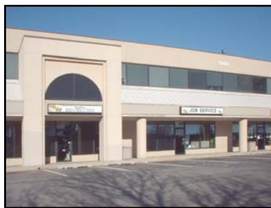
Maryland State Employment Services