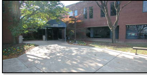
FIRN 입구: 콜럼비아 사무실