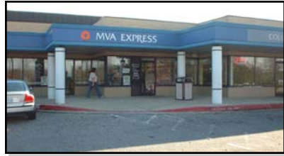
콜럼비아 MVA Express, Co-

면허증 갱신, 면허증의 이름과 주소 변경, Photo ID 카드, 운전경력 기록 발급과 번호판 반납 서비스 만 제공.