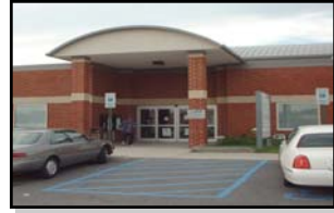
벨츠빌 MVA 사무실