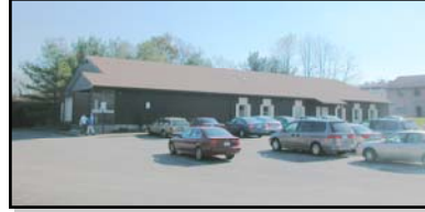
하워드 카운티 기독교 봉사 상점