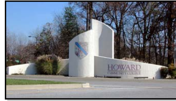
Little Patuxent Pkwy에 위치한 HCC 입구

하워드 커뮤니티 칼리지는 두 곳에서 영어수업을 제공합니다. 가을과 봄에 열리며 주로 책 값외에는 무료입니다. 등록은 수업 시작하기 몇 주 전에 시작되는데 등록이 빨리 차기 때문에 일찍 등록하십시오. 날짜와 시간에 관해 전화로 문의하십시오.