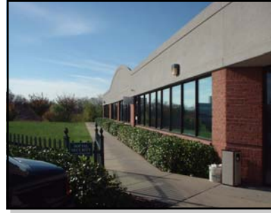
사회보장국 레이크사이드 사무실

전화: 410-872-4758 또는 1-800-772-1213 월-금요일, 오전7시-오후 7시 (전화 문의 시간)